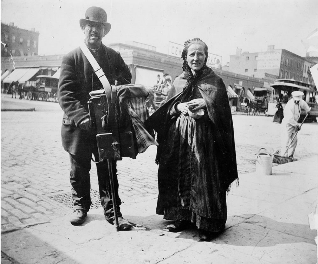
Ill. 4: Lirekassemand og kone i New York i 1880'erne.