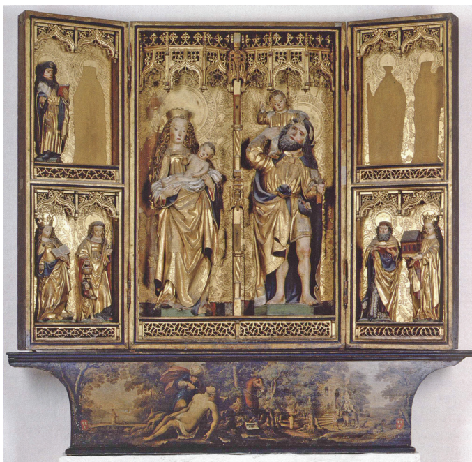
Ill. 3. Det såkallade Rese-altarskåpet från Maria-kyrkan i Lübeck (1499), nu i St. Annen-Museum, Lübeck. Foto ur: Corpus der mittelalterlichen Holzskulptur und Tafelmalerei in Schleswig-Holstein. Hansestadt Lübeck, St. Annen-Museum, Uwe Albrecht (red.), Kiel 2009, s. 284.

Högaltarskåpet i Trondenes appellerade med stor sannolikhet till den senmedeltida förkärleken för en koppling mellan det religiösa och det levda livet (ill. 4). Huvudtemat är den heliga släkt, alltså Marie halvsysstrar, barn och deras män. 9 Själv har jag ifråga om skulpturerna och skåpets typologi pekat på Lüneburg, den gamla ”saltstaden” inte långt söder om Lübeck. I Lüneburg finner man följande särtecken: Skåpen brukar vara en-och-enhalvradiga, alltså försedda med