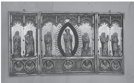
Ill. 6. Altarskåpet i Fresta, Uppland. Foto: Nils Lagergren, ATA, 1948.

radiga altarskåp finns i hela Nordtyskland sedan 1300-talet. Jag vill dock poängtera att det inte bara är de två registren jag pekar på, utan hela anläggningen med sina extremt trånga nischer och övriga karakteristika jag angav ovan, som är säregna för altarskåpstypen förbunden med Lüneburg som produktionsort. Hoffmann för däremot en annan intressant jämförelse i diskussionen: de svenska altarskåpen från Ål (Dalarna, ill. 5) och Fresta (Uppland, ill. 6). Båda uppvisar en centralt stående Maria i strålkranz omgivna av den heliga släkt. Skulpturerna står som i Trondenes i två register, och de manliga medlemmarna förvisas till det nedre registret. Dateringen brukar vara i slutet av 1400-talet. Enligt Hoffmann bygger de svenska verken på en förlaga snarlik den i Trondenes. Ål och Fresta – och också Trondenes högaltarskåp – förstår hon alltså som verk från Lübeck. Forskningen har hittills pendlat mellan att bestämma