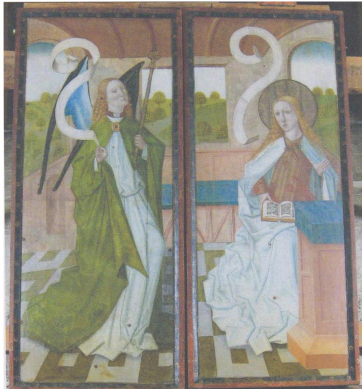
Ill. 7. Högaltarskåpet i Trondenes kyrka, de yttre sidorna på flyglarna.

etlike wort van wegen ener tafelen myt bylden scal gehad hebben