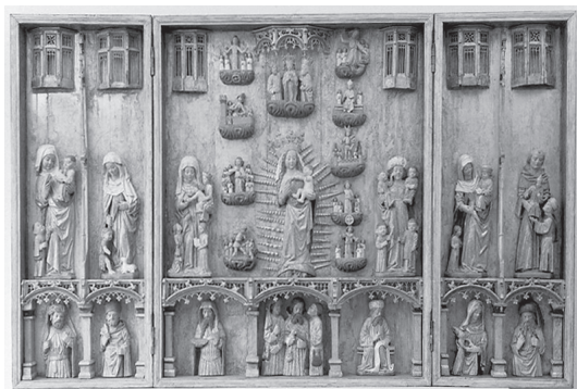
Ill. 5. Altarskåpet i Ål, Dalarna.