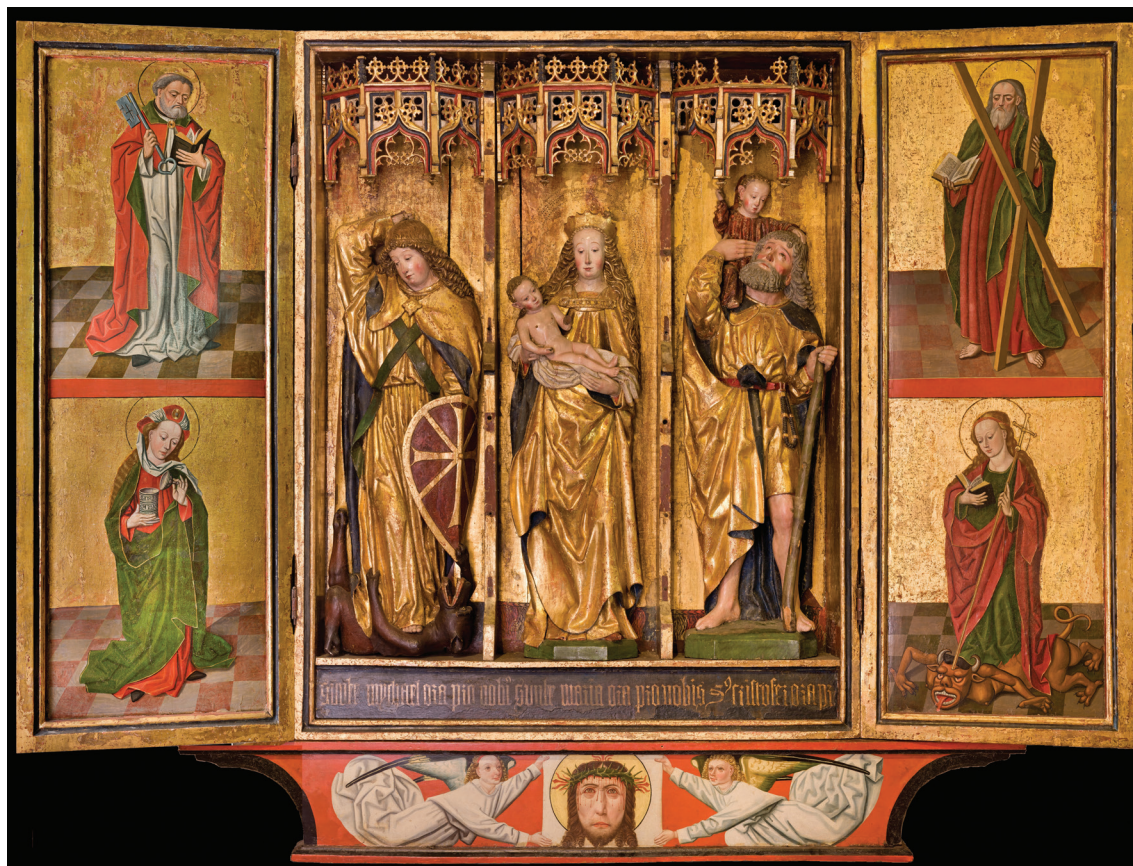
Ill. 2. Norra altarskåpet i Trondenes kyrka (ca. 1490). Bilden är redigerad (den vänstra spetsen på predellan är tillagd).

I Nord-Norge norr om Trondheim befinner sig (eller befann sig) huvuddelen av den sen-medeltida träskulpturen i landet. Den var till stor del importerad från konstproducerande orter i Nordtyskland och Nederländerna. Att Nord-Norge förevisar mer träskulptur än i den södra landsändan förefaller gå tillbaka på det relativa välståndet som exporten av torrfisk förde med sig. Ätminstone vissa sockenbor i församlingarna kunde kosta på sig dyrbara skänker till kyrkan – eller så fanns det stormrika handelsmän i utlandet, t. ex. Bergenfararna, som gärna lät stiftelser av olika slag tillkomma kyrkorna långt bort i norr. Bergenfararna var en sammanlutning köpmän i Lübeck och andra hansestäder som främst handlade med Bergen och som hade speciella rättigheter genom hansekontoret där. Altarskåpen, liksom andra lyxprodukter, transporterades genom samma sjöleder som användes för att skeppa säd och textilier norrut i utbyte mot torrfisken. Utbredningen och handeln av de stora medeltida altar-