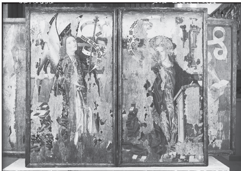
Ill. 8. Altarskåpet i Möja kyrka, Uppland, de yttre sidorna av flyglarna.

Detta betyder ungefär att Franke skall ha växlat åsikter kring "en tavla med bilder". I brevet från staden Bergen ber man rådet i Lüneburg om att vara föreståndaren till hjälp vid inköpet av tavlan, så att 'Gud igen kan bli prisad i kyrkan, där alla köpmän ofta brukar samlas'. Man kan tolka detta