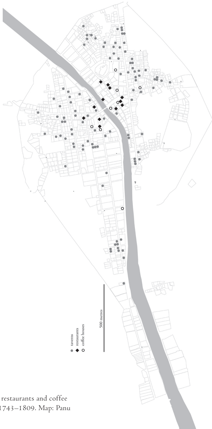
Figure 6. Taverns, restaurants and coffee houses of Turku, 1743–1809. Map: Panu Savolainen.