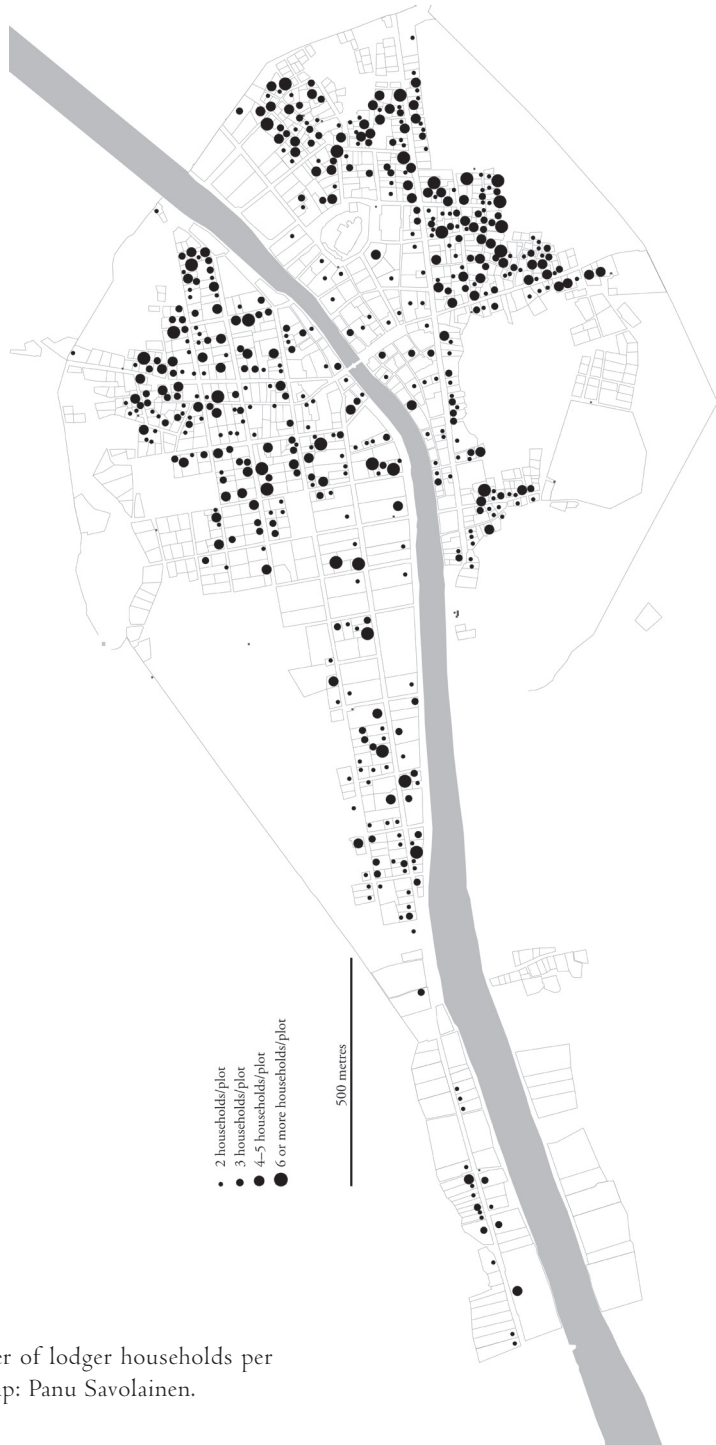
Figure 5. Number of lodger households per plot in 1775. Map: Panu Savolainen.