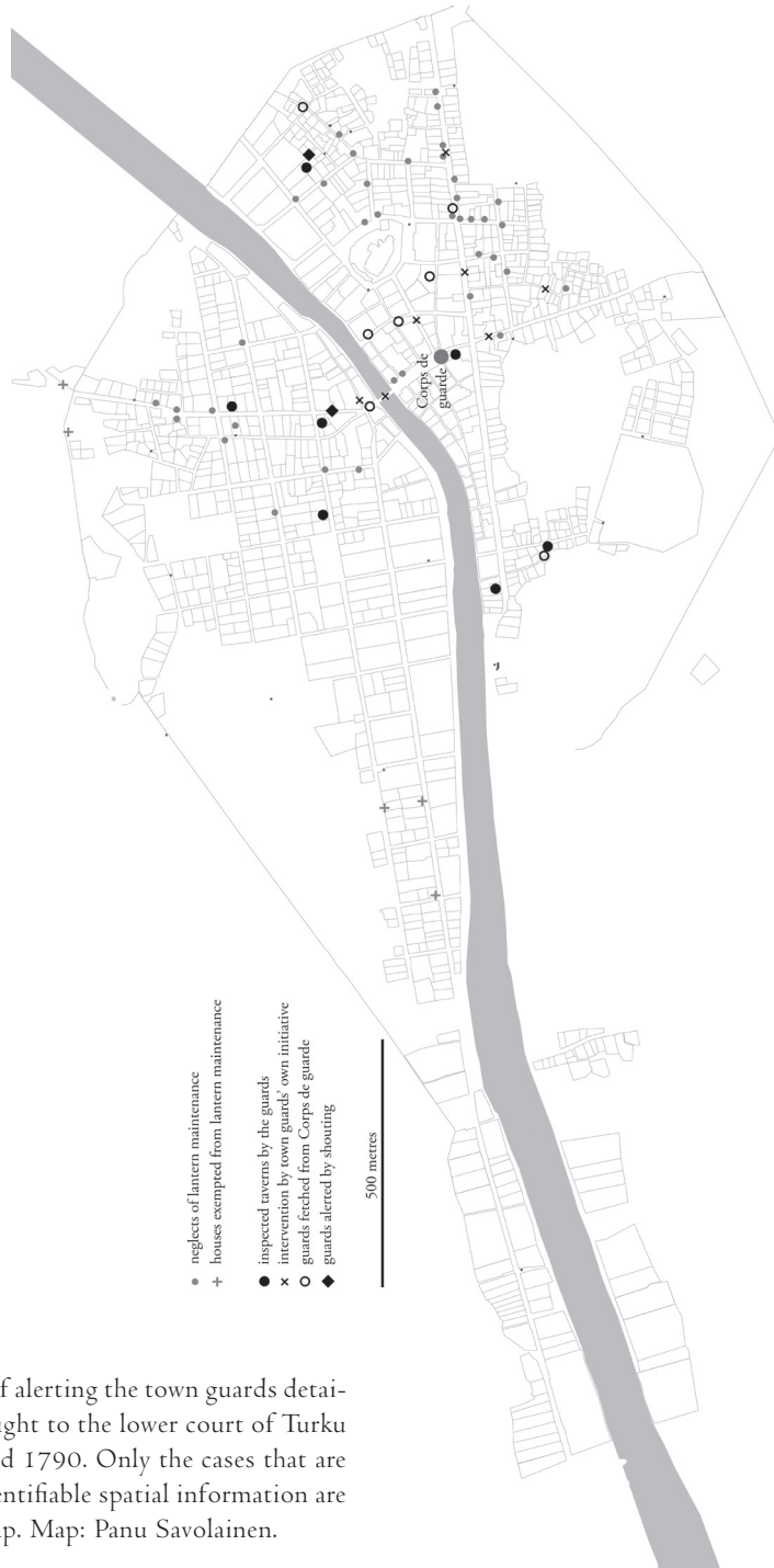
Figure 7. Means of alerting the town guards detailed in crimes brought to the lower court of Turku in 1760, 1775 and 1790. Only the cases that are described with identifiable spatial information are plotted on the map. Map: Panu Savolainen.