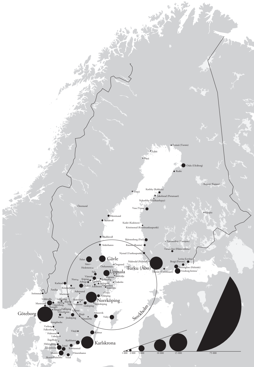
Figure 1. The population of the towns in Sweden in 1800. Sources: Historisk statistik för Sverige, del. I. Befolkning (Stockholm: Statistiska centralbyrån, 1969), pp. 61–62; Suomen kaupunkilaitoksen historia, tilasto-osa (Helsinki: Suomen kaupunkiliitto, 1984), pp. 12–13. Map: Panu Savolainen.