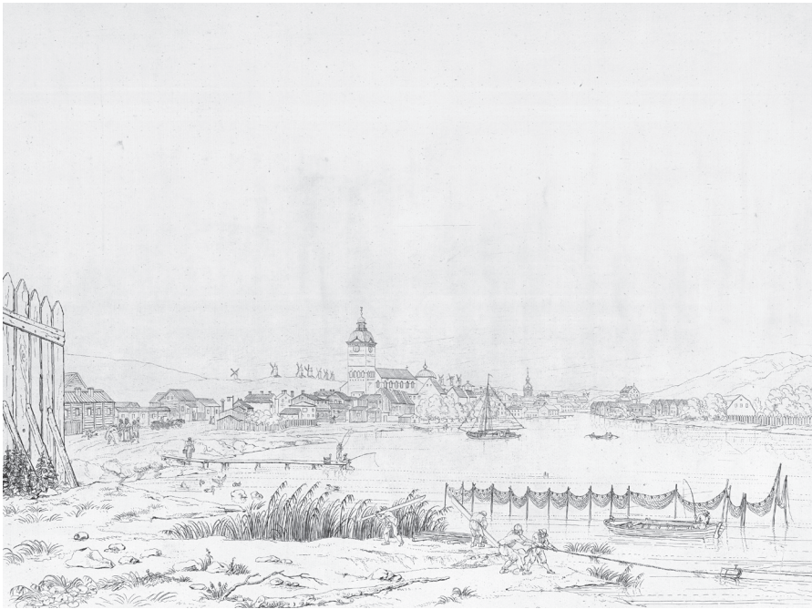
Figure 3. The town of Turku in 1798, as seen downstream from the town. The Royal Library, Stockholm.

century, extensive improvements were made to the townscape of Turku. The urban administration ( magistrat ) and the advocates of royal power stipulated regulations to render private construction more elegant; furthermore, public projects, such as pavements and street lighting, received increasing attention from the higher authorities. 18 The closing decades of the eighteenth century were an active period of progress in private construction, and the townscape was constantly being renewed. However, there were only minor changes to the town plan in Turku, and all the new districts were all located in the outskirts of the town. 19 Despite the recommendations to build in stone and the tax exemptions for stone buildings, the majority of the buildings in the town were still one- or two-storey wooden houses, which was the case in most eighteenth-century Swedish towns. 20