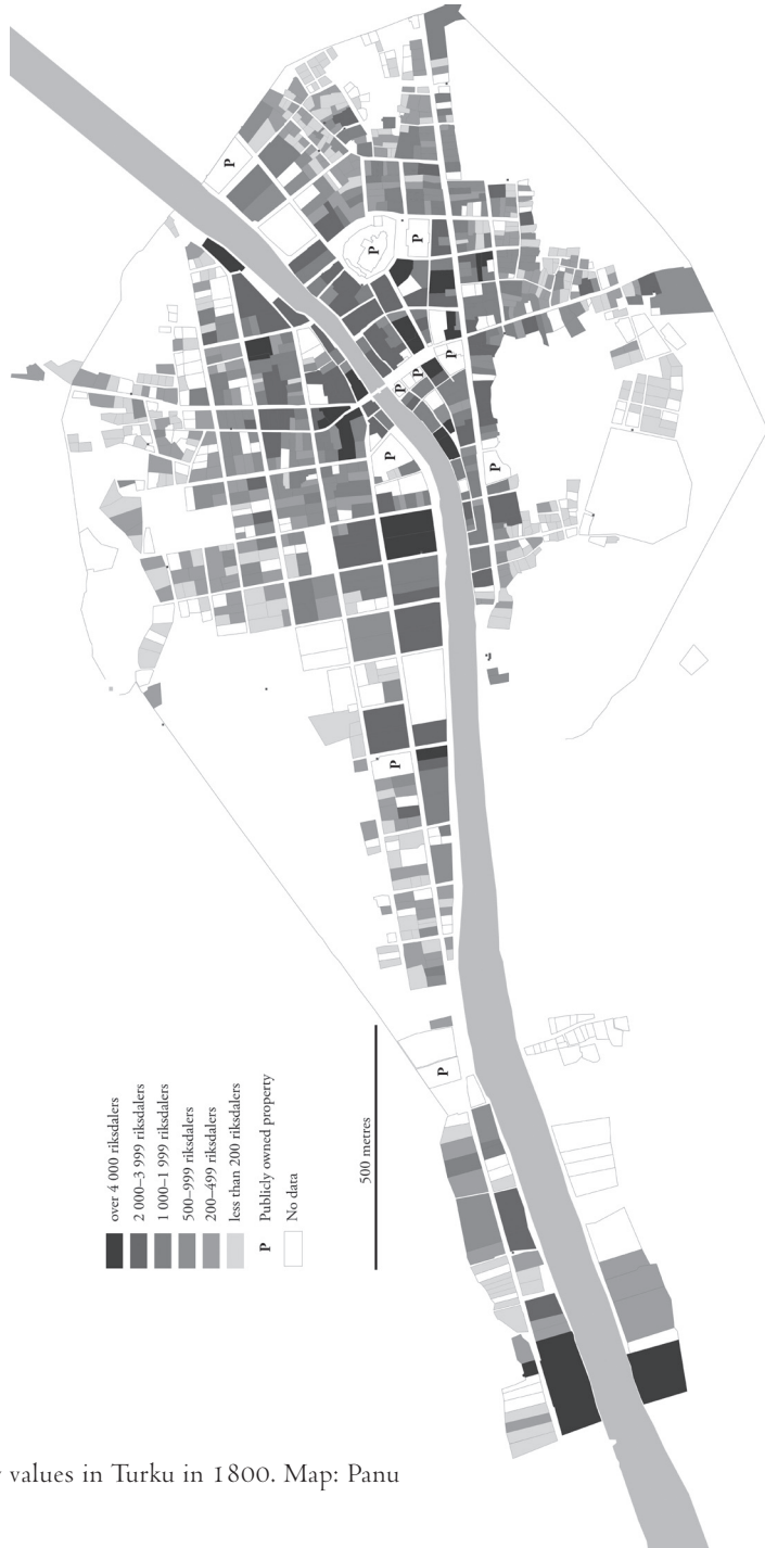
Figure 4. Property values in Turku in 1800. Map: Panu Savolainen.