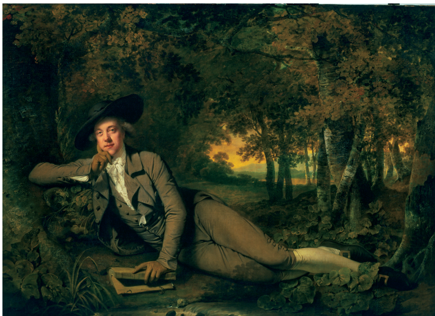
Joseph Wright of Derby (1734–1797), Sir Brooke Boothby , 1781. Olie på lærred, 147,6 x 207,6 cm. Tate Britain.

vi for eksempel på den engelske kunstner Thomas Gainsborough's (1727–1788) landskaber, så er hans fjeragtige træer langt fra Juels egetræer, og hans vækster i forgrunden er ikke afbildet med samme detalje som Juels.