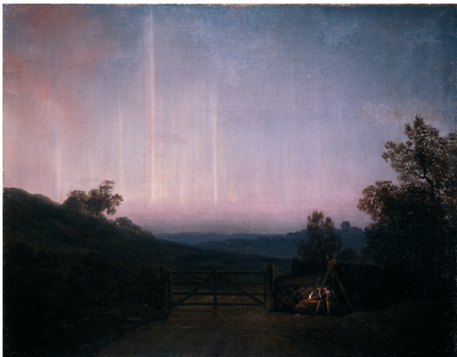
Jens Juel, Landskab med nordlys . I baggrunden Middelfart kirke. Forsøg på at male nordlyset, antagelig 1790'erne. Olie på lærred, 31,2 x 39,5 cm. Ny Carlsberg Glyptotek, København.

Lysning, som udi mange Timer var at see til ligesom den klareste Morgenrøde [...] ligesom det kunde været en lang Rad hvide og sortagtige Pæle skifteviis (alternatim) hos hin anden opsatte og stode lige ret op paa Horizonten”. 45 Ud fra Ramus gennemgang kan man konkludere, at nordlyset var en del af den generelle folkelige tro på vejrvarsler. Nordlyset kunne virke skræmmende, når det var i bevægelse, således troede nogle at det var krigshære, der kæmpede med hinanden på himmelen.