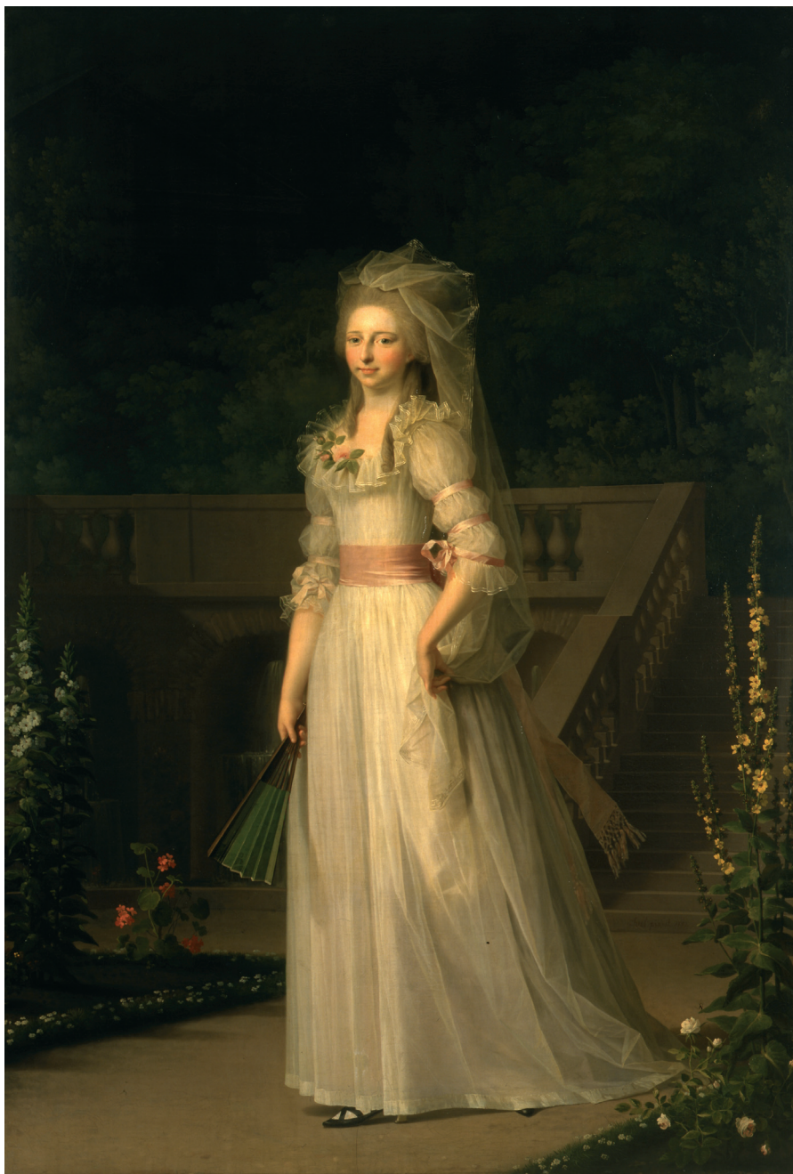
Jens Juel, Prinsesse Louise Augusta, 1787. Olie på lærred, 253 x 160 cm. Det Nationalhistoriske Museum, Frederiksborg.