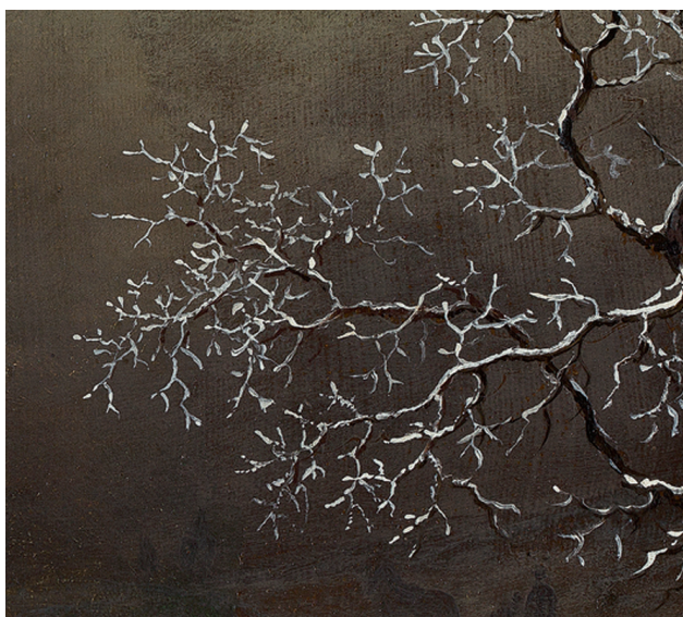
Jens Juel, Vinterstykke forestillende Rimfrost , 1790'erne? Olie på lærred, klæbet op på træ, 23,5 x 27,5 cm. Privateje.