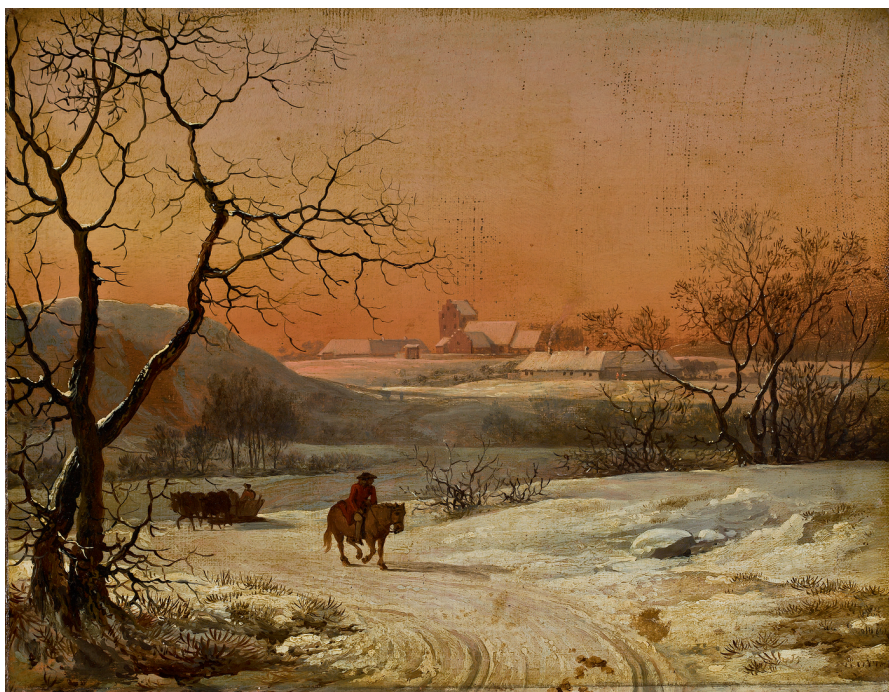
Jens Juel, Vinterstykke ved nedgående sol , 1790'erne? Olie på lærred, klæbet op på træ, 25,5 x 33,5 cm. Privateje.

er det, som blæser fra Norden [...] og ødelægger den halve Deel af Skabningen?” 31 Svaret på dette står klart i samtlige skrifter jeg har gennemgået fra perioden; det er den samme gode Gud som den, der har skabt sommerens glæder. Sneen er, ifølge Balling, nyttig, fordi den beskytter vækster og planter nedenunder mod de hårde vinterstorme, og derfor danner sneen udgangspunktet for forårets vækst. 32 Vinteren beskrives som en hviletid for naturen, hvor menneskene kan nyde efterårets høst.