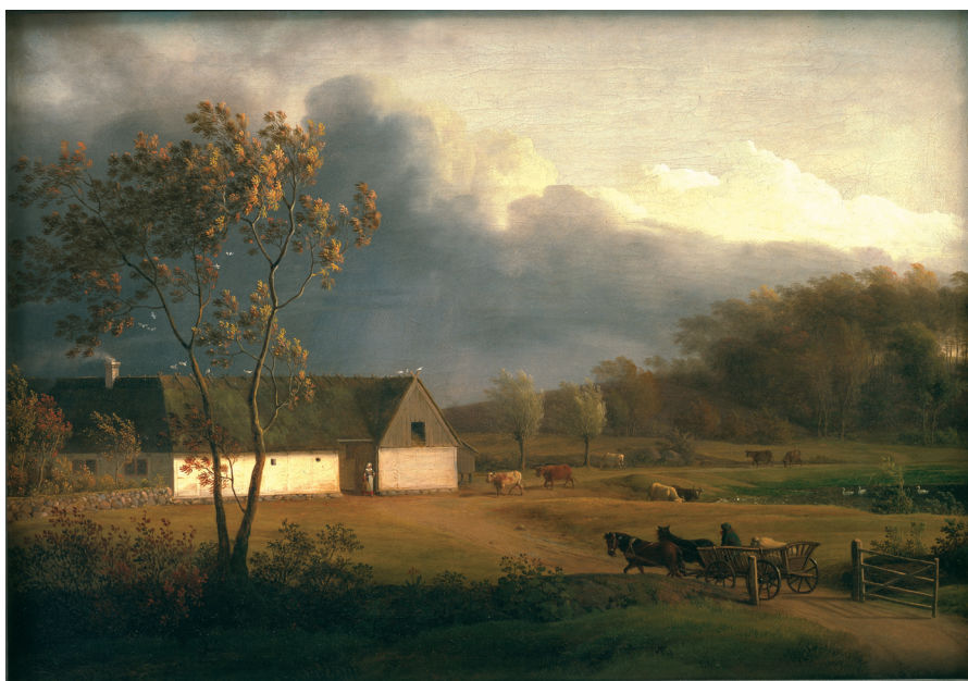
Jens Juel, En sjællandsk bondegård under et optrækkende uvejr. Eigaard ved Ordrup, antagelig 1790'erne. Olie på lærred, 43 x 61 cm. Statens Museum for Kunst

I Juels afbildninger af uvejr er det oftest optrækkende eller bortdragende, hvilket giver ham en mulighed for at afbilde kontrasten mellem lys og mørke. I En sjællandsk bondegård under et optrækkende uvejr. Eigaard ved Ordrup river vinden i træerne og i bondens hår, mens han skynder sig hjem på sin pindevogn, inden uvejret rammer. Det er således, som hos Poussin og Vernet, det ydre, der påvirker menneskets handlinger. Mennesket virker dog ikke truet på sin eksistens, idet gården står lysende og velholdt parat til at tage imod ham. Hans hustru står i porten, som hun nok har åbnet, så han hurtigt kan komme i læ. Juel er her optaget af de synlige tegn på uvejrets komme. Vinden i træerne der får bladene til at afsløre deres underside,