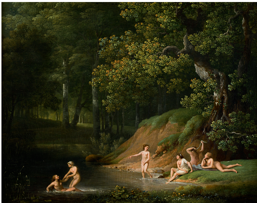
Jens Juel, Skovlandskab med badende kvinder , 1785. Olie på lærred, 31,5 x 40 cm. Privateje.