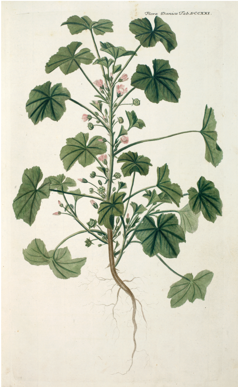
Flora Danica , hft. 13, tab. 721, Rundbladet Katost, 1778. Det Kongelige Bibliotek.