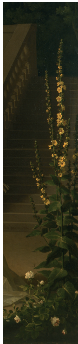
Flora Danica , hft. 19, tab. 1088, Mørk Kongelys, 1794. Det Kongelige Bibliotek.