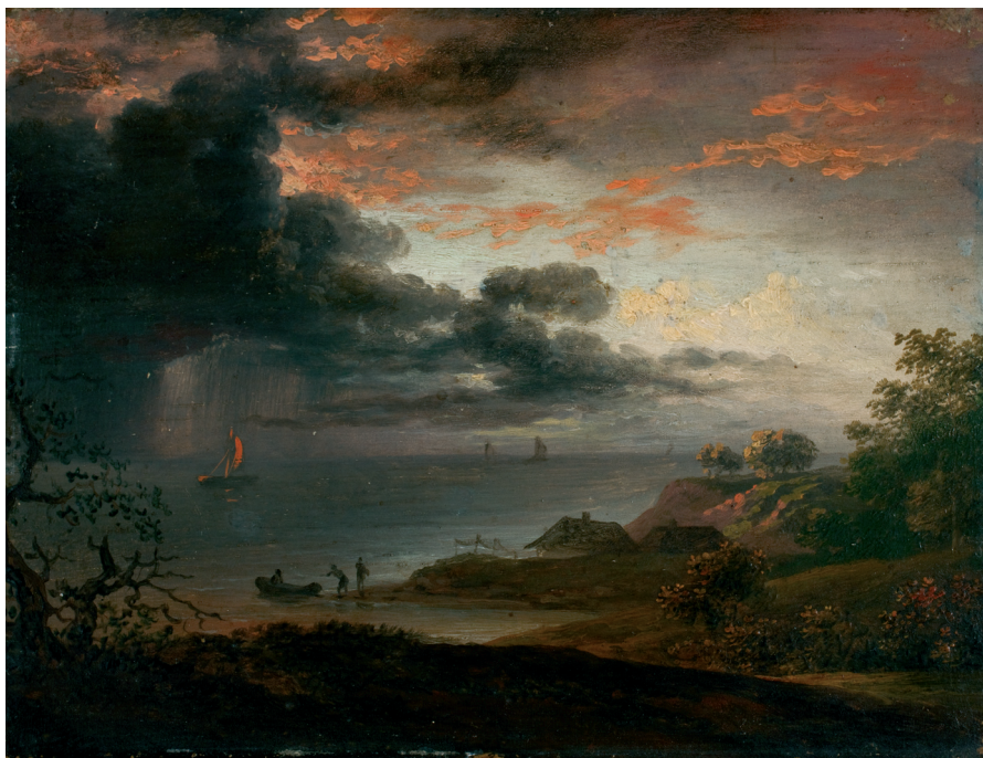
Jens Juel, Tordenregn nedstyrtende i havet , 1791. Olie på træ, 12 x 16 cm. Statens Museum for Kunst, © SMK Foto.

hvormed der opstår et orange farvespil og ikke mindst det kontrasterende møde af lys og mørke, som opstår, når himmelen bliver sort.